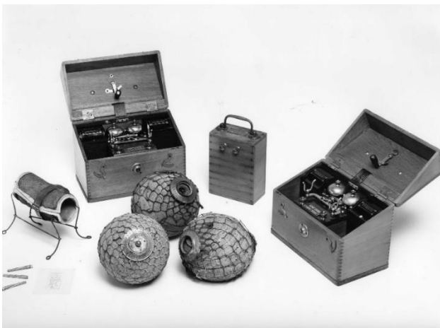
Utrustning från Andréexpeditionen

Titta på alla saker som Andrée, Strindberg och Fraenkel hade med sig. Vilka saker tycker du var de viktigaste som de hade med sig? Välj tre saker och tala om varför du valde just dem?