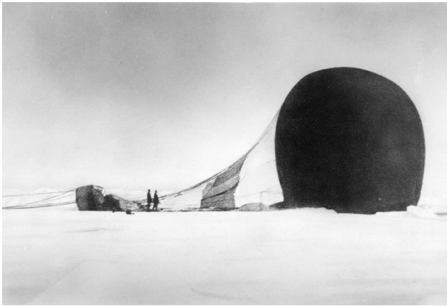
Ballongen Örnen har landat, 14 juli 1897

Varför skulle Andrée flyga över Nordpolen? Vad var syftet med resan?